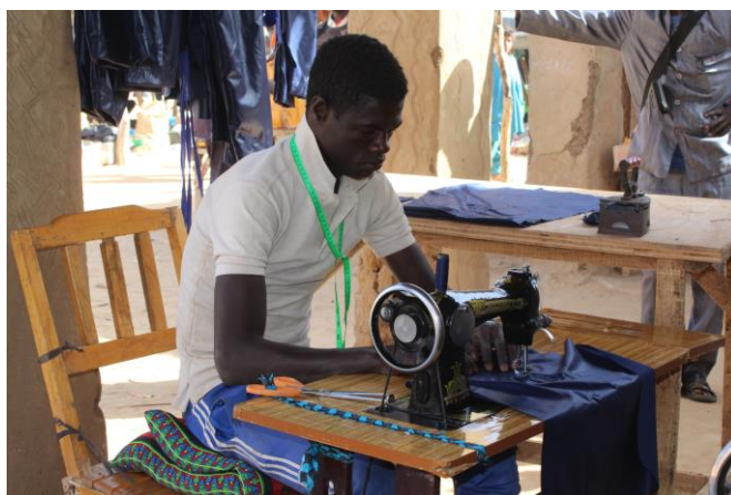
Participant au cours de couture

En collaboration avec le Dominikus-Ringeisen-Werk (DRW) et le Arbeiter-Samariter-Bund (ASB), Apprentissage pour le retour mène des actions de qualification adaptées aux besoins pour les réfugié·e·s maliens et pour la population des communautés d'accueil dans la région de Tahoua. Une attention particulière est accordée à l'implication des femmes et des jeunes.